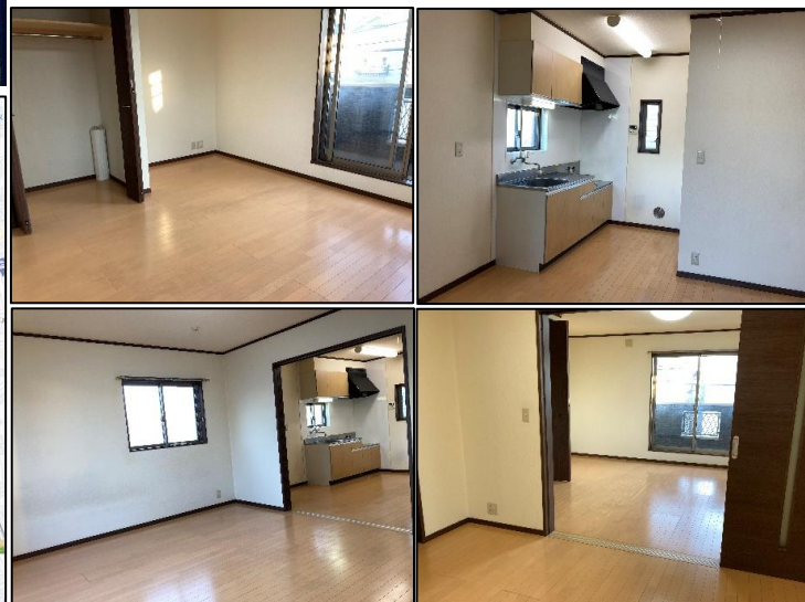
※図面・写真と現況が異なる場合は、現況を優先させていただきます。