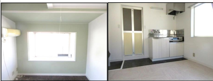
※図面・写真と現況が異なる場合は、現況を優先させていただきます。