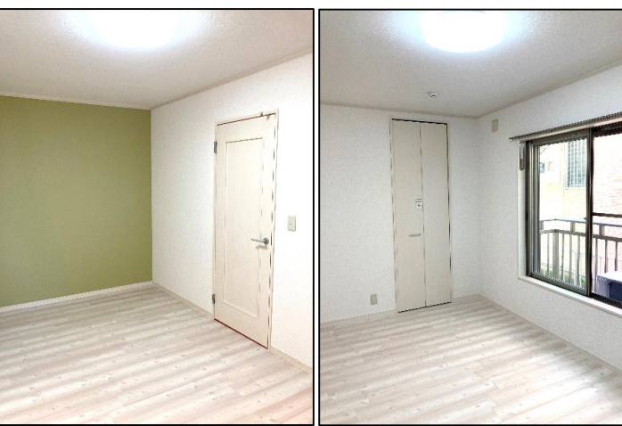
※写真は別部屋の画像です。